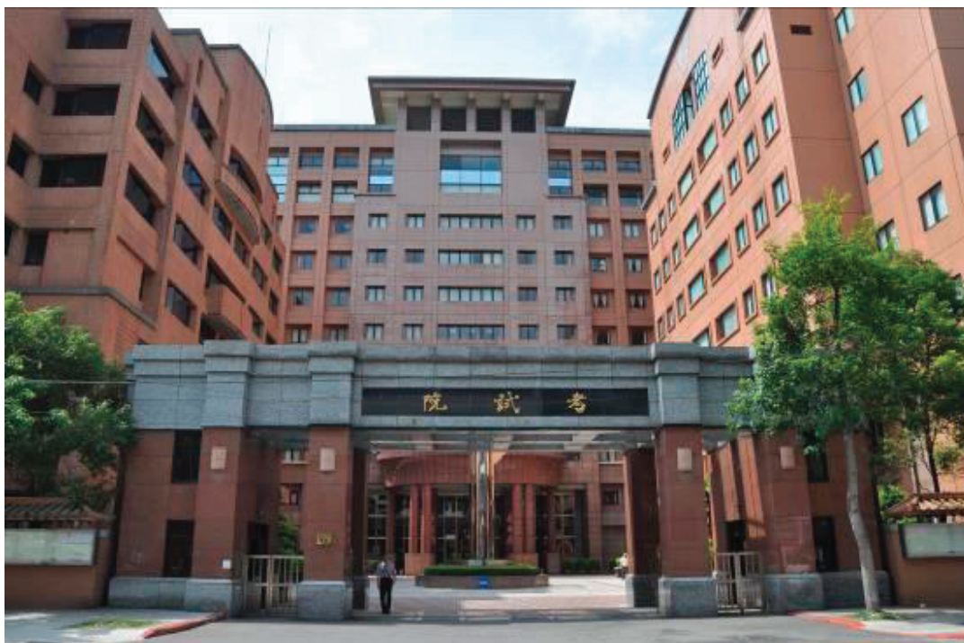
附圖一、考試院外觀