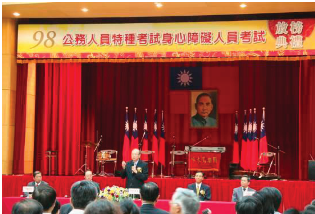
附圖二、作者主持民國 98 年公務人員身心障礙特考放榜典禮