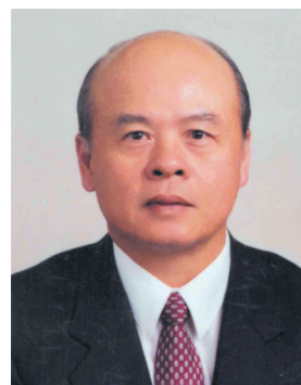
保訓會 鄭吉男 常務副主任委員