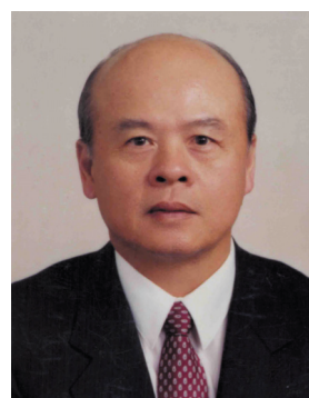
保訓會 鄭吉男 常務副主任委員